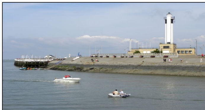
Un air de vacances à la côte

Se promener est très agréable, surtout si vous êtes fan de bandes dessinées et avez le loisir d'admirer vos héros préférés. Sur la digue vous y trouverez pas moins de 12 : Néro – Jommeke – Bob et Bobette – Spirou et Fantasio - Kiekeboe – Lucky Luke – Urbanus – les Schtroumpfs – Lambique – les jumelles Rozemieke et Annemieke – Fanny et la nouvelle statue de bronze de Cedric.