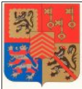
Blason de l'entité de Zwalm